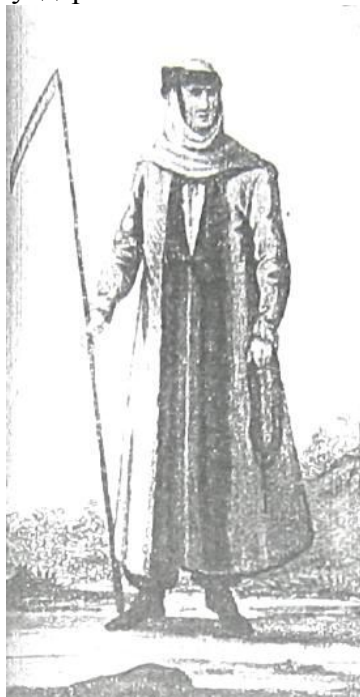
Кистинка (рис. начала XIX в.)