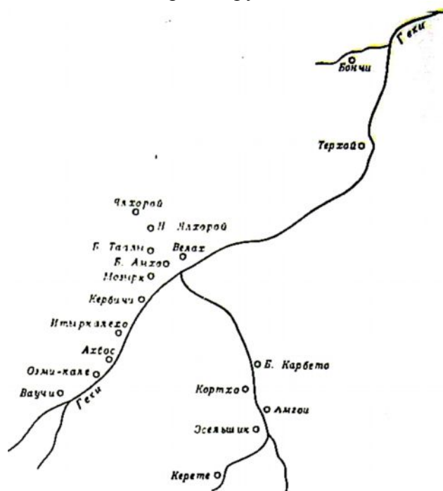
Аккинское общество в 60-х годах XIX в.

Названия малхистинских селений, сообщаемые документом 1839 г., известны и в источниках второй половины XIX в.; а также фиксируются в полевых материалах. По описанию А. Зиссермана, чеченское общество Митхо находилось в 10 верстах от Шатили и имело 6 маленьких населенных пунктов. Отмечая своеобразие населения этого общества, тот же автор пишет: «Они называют христиан неверными, а поклоняются Св. Георгию, не делают намаза, не едят свинины, не имеют мулл и мечетей» 236 . Г. Радде, побывавший в этих краях в 1876 г., сообщает о 10 митхойских селениях, располагавшихся по левому притоку р. Аргуна ручью Митхой, в которых насчитывалось 174 двора 237 . Самым большим из них было сел. Бонист, имевшее 22 двора. Сравнение численности населения малхистинцев по данным 1839 г. и сведений Г. Радде за 1876 и говорит о значительном уменьшении числа жителей в этом обществе за прошедшие 37 лет. Объяснение этому явлению следует искать в трудном экономическом положении малхистинцев — отсутствии удобных земель, что и вызывало систематический отлив местного населения в районы Чечни и горной Грузии.