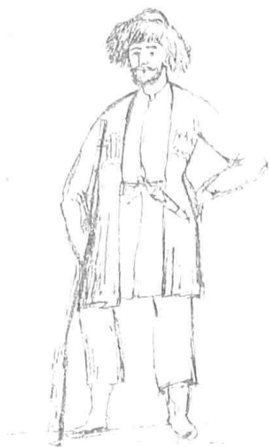
Чеченец в своем селении (рис. 30-х годов XIX в.)

Полевые материалы показывают, что еще более ранним (6—7 поколений) по сравнению с заселением по р. Гумсу было движение ичкеринцев в предгорья по течению р. Аксай (Ясси). Здесь возникли Ишхой-юрт, Мескеты (левобережье Ясси), Заманюрт (правобережье той же реки) и др. Население этих селений образовалось из ичкеринских тейп — преимущественно Аллерой, Шуаной, Гендергеной 269 . Как происходило расселение