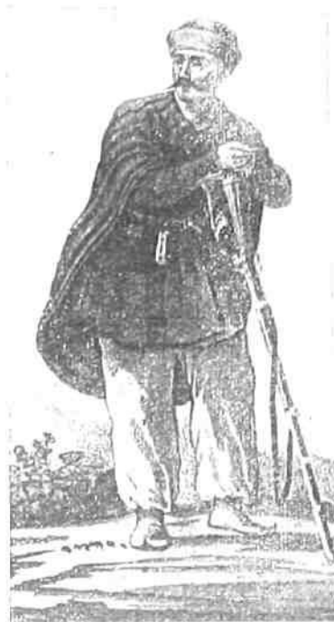
Кистинец (рис. начала XIX в.)

С тех пор село стало называться по имени князя» 216 . Основателем селения считается ичкерийская тейпа Гендергеной. Кроме них здесь живут выходцы из Ичкерии Зандкой, Аллерой, Цонтарой, Чертой, Чермой, а также Таркой и Арганой на Дагестана. Все они переселились с гор три поколения тому назад, считая современное старшее поколение 217 .