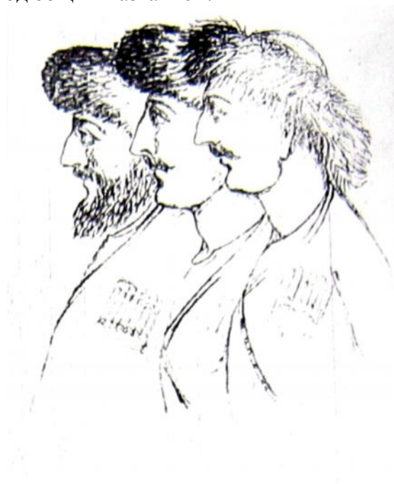
Чеченцы (рис. 30-х годов XIX в.)

«К западу от ичкеринцев в горах но ущелью Джалки и Аргуна,— пишет далее Д. Милютин,— жили Чарбили (Чабуртлы), Шубуды и Шатойцы» 232 ). Численность этих племен определилась весьма приблизительно. Например, чарбилойцы составляли около 3 тыс. душ м. п. Большая часть их жила по хуторам, так что несколько близких хуторов составляли одно селение под общим названием.